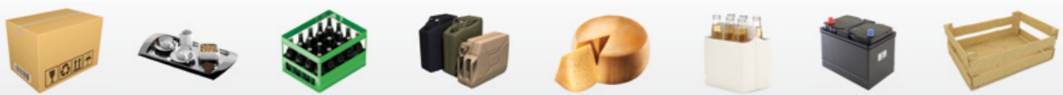
Key Components for material handling: • Safety Fencing • Vertical Conveyors • Palletising Modules