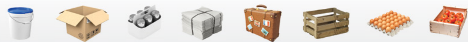
Key Components for material handling: • Safety Fencing • Vertical Conveyors • Palletising Modules